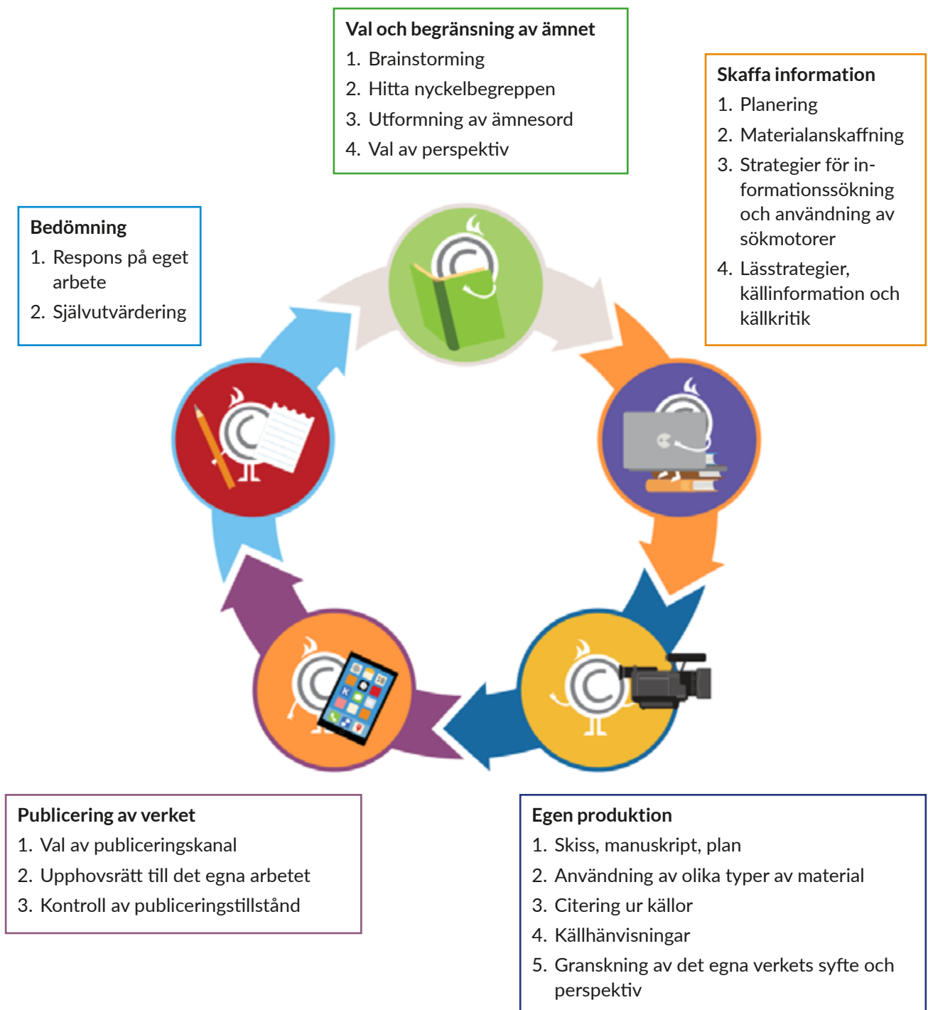
BILD 5. Den studerandes eget arbetes steg

Upphovsrättsrelaterade kunskaper och färdigheter är en del av multilitteraciteten, eftersom de behövs i kreativt skapande när man 1) använder, 2) producerar och 3) delar innehåll. Processen för det kreativa skapandet följer projektarbetets olika skeden, som beskrivs i materialet om kreativt skapande (BILD 5). Modellen kan användas i vilken kurs som helst där man arbetar med olika slags projektarbeten.